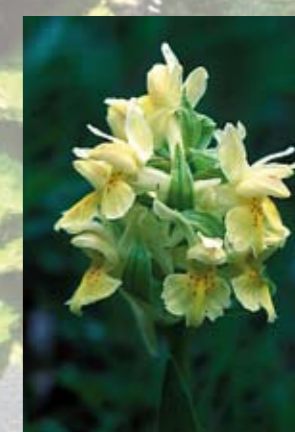
Adam och Eva